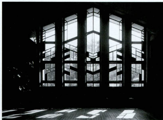
明日館所在地 東京都豊島区西池袋2-31-3

自由学園 事務室 明日館係 〒203-8521 東京都東久留米市学園町1-8-15 TEL.0424-22-3111(内線)228 FAX.0424-22-1078