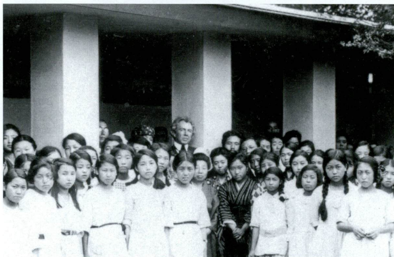
ライト送別会(自由学園の生徒と共に) 1922年7月