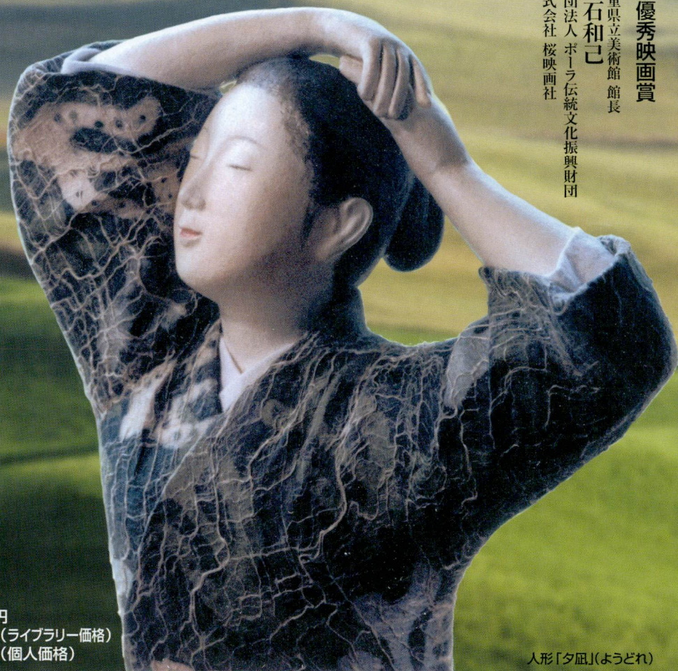
人形「夕風」(ようどれ)